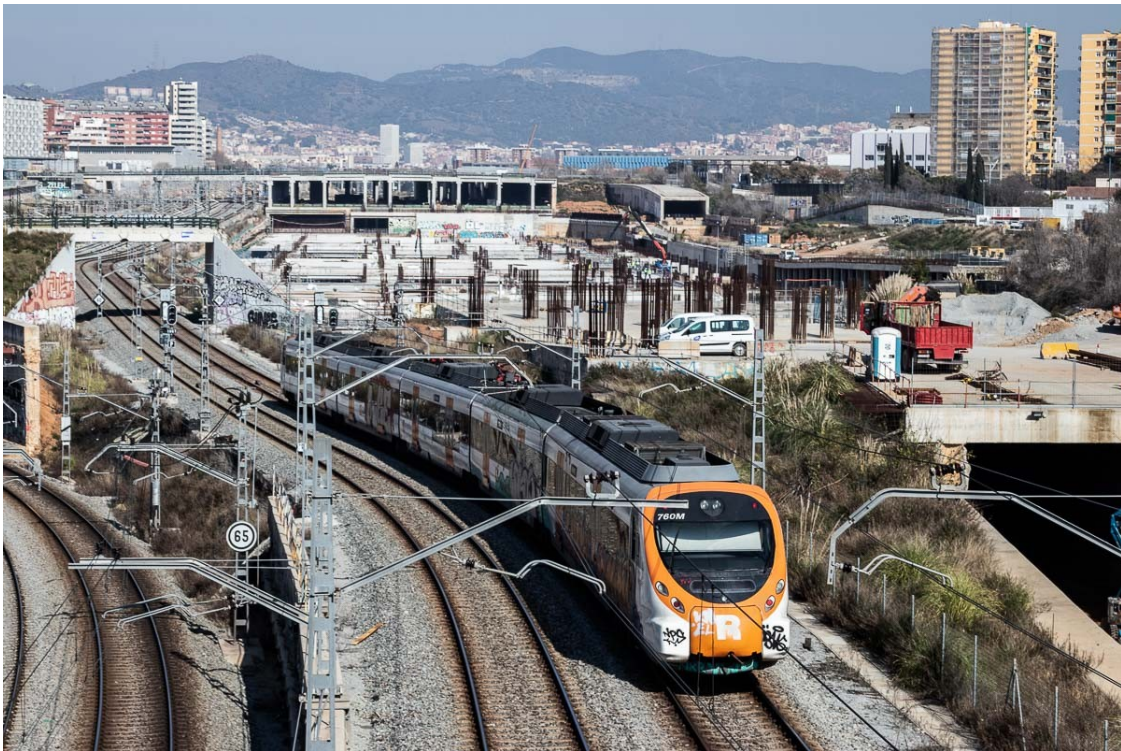
Un tren de Rodalies circulant per la xarxa de Barcelona

FemVallès proposa que es construeixi entre l'estació de França i la zona del Morrot, a Sants-Montjuïc