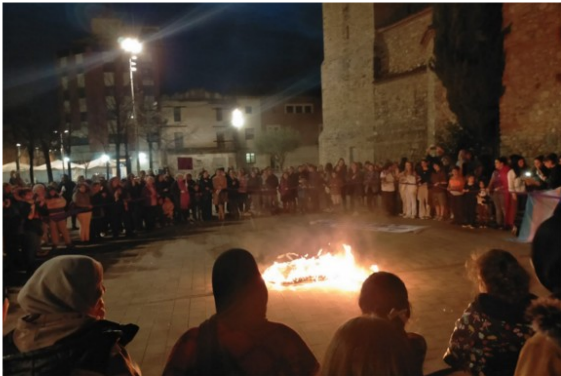
Foc per «cremar el patriarcat»