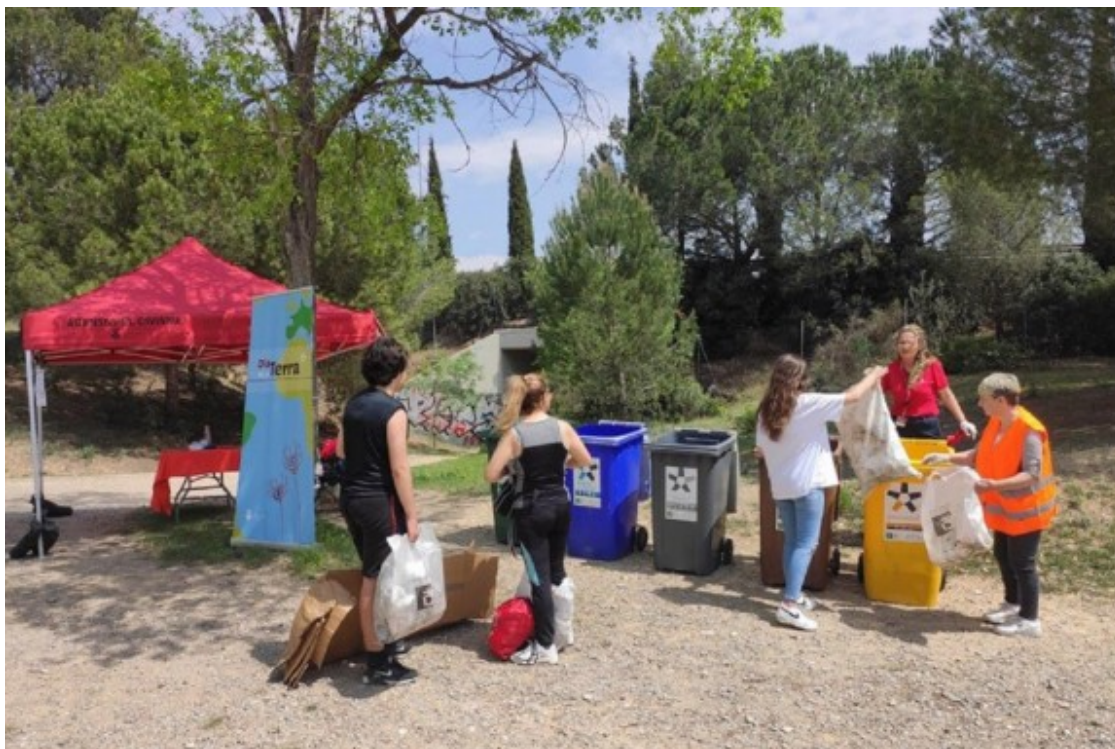
Les Agents Cíviques col·laboren en una trastejada