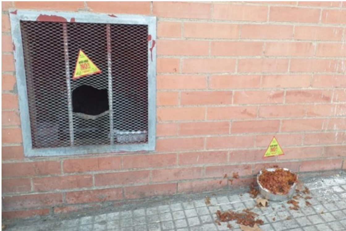
Restes orgàniques al Passatge Barcelona

A més de coloms i cotorres, també s'ha detectat un augment de l'alimentació dels gats de carrer al Passatge Barcelona - restes orgàniques i menjar humit, que van comportar un increment de queixes per la presència de rates i brutícia a la zona -, amb la qual cosa es va mantenir una reunió informativa amb la presidenta de l'Associació de Veïns i un porta a porta per 87 pisos del barri.