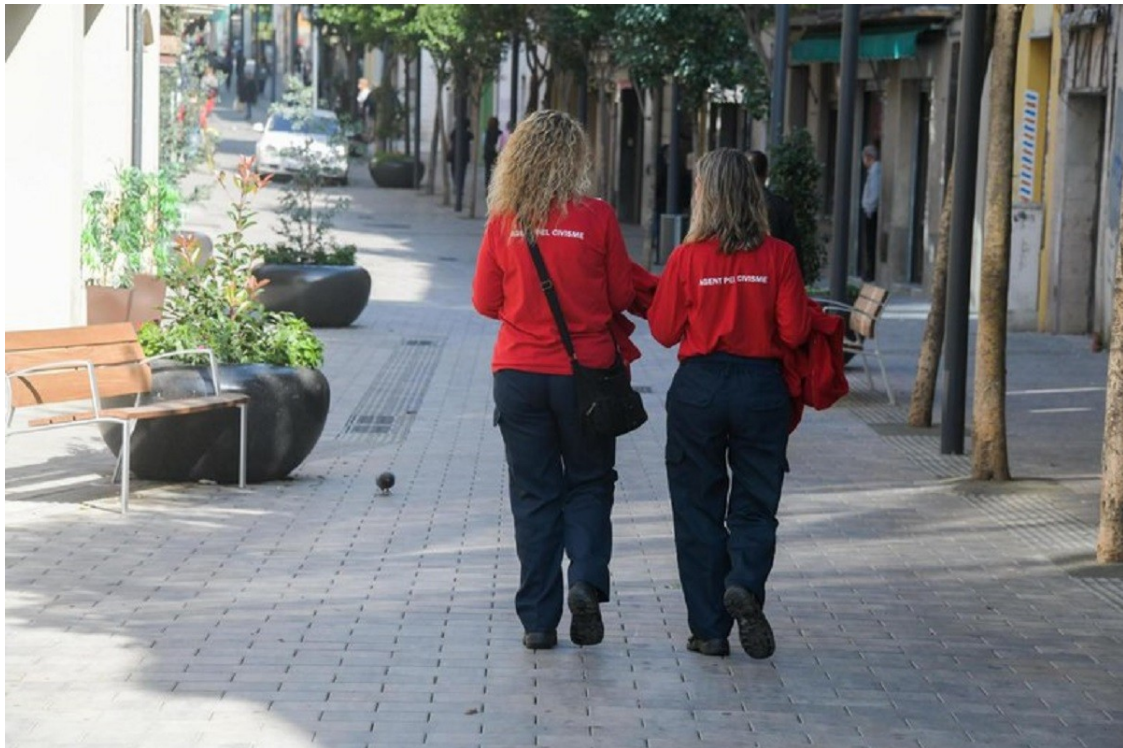
Agents pel Civisme caminant per Rubí | Ajuntament de Rubí

Han detectat gairebé 5.000 conductes irregulars en matèria de mobilitat, mentre que el gran gruix de les queixes rebudes són per desperfectes i manteniment de la ciutat