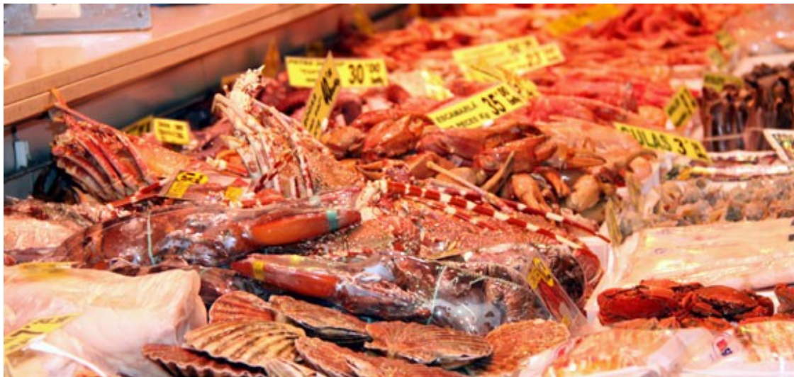
El marisc, l'escollit per acomiadar l'any.

Ara bé, el lluç no és el que més s'apuja de preu. El producte que lidera el rànquing de l'OCU són els anomenats percebes gallegos , amb una pujada de fins al 44% en molts casos. També pateixen un augment considerable en els darrers 15 dies les cloïsses (7%) i el besuc (8%).