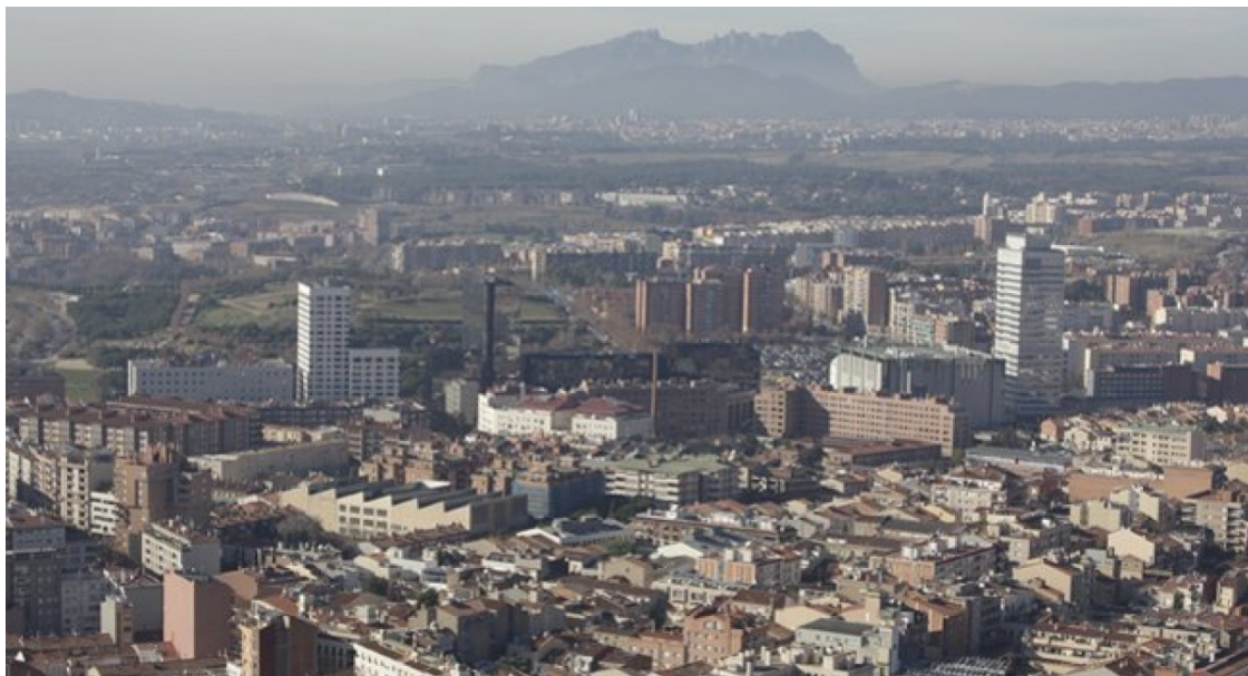
Sabadell, amb Montserrat al fons | Ajuntament de Sabadell

Moianès i el Berguedà són les dues comarques que lideren la creació d'empreses a la demarcació