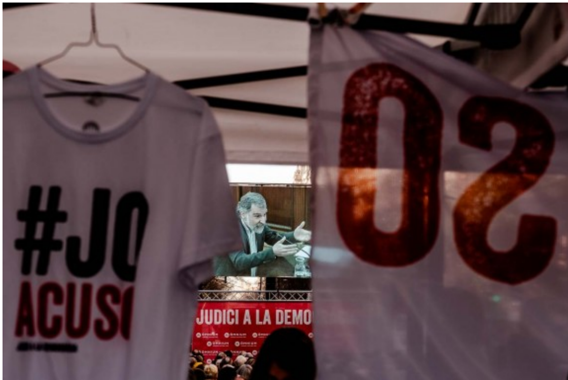
Centenars de persones segueixen la declaració de Cuixart al judici davant de la seu d'Òmnium

- La lluita no-violenta té per objectiu el diàleg. Recull tres estadis: la protesta i persuasió, la no-cooperació i l'acció no-violenta. Sempre apostarem per una solució dialogada. De fet com que renunciem explícitament a l'ús de la violència el que fem es treballar pel diàleg. Avui, però, som molt escèptics amb aquest PSOE de Pedro Sánchez. Fa temps que té a les seves mans encarrilar la resolució del conflicte, però continua acomplexat per la dreta i l'extrema dreta.