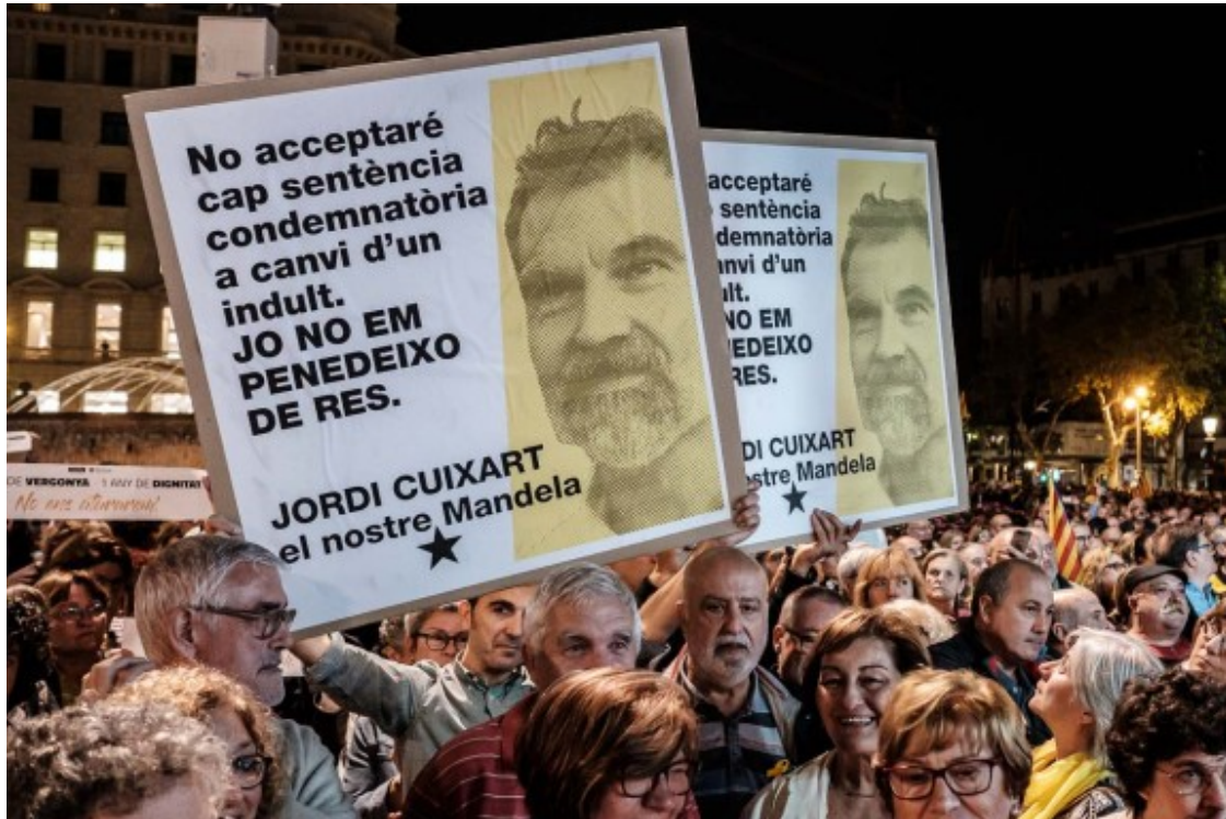
Cartells amb el rostre de Jordi Cuixart, en una manifestació a plaça de Catalunya.

estèrils, com quin paper havia de jugar cadascú a la manifestació. Ara cal tenir-ho present. Si passa el mateix que el 2010, pot succeir que tot canviï al voltant dels partits. El que no canviarà és la societat catalana. La sentència serà una prova de foc per als partits polítics. Més enllà dels pactes, caldrà respondre atenent aquestes grans majories. S'ha acabat el temps de les ambigüitats: la inacció els passaria factura.