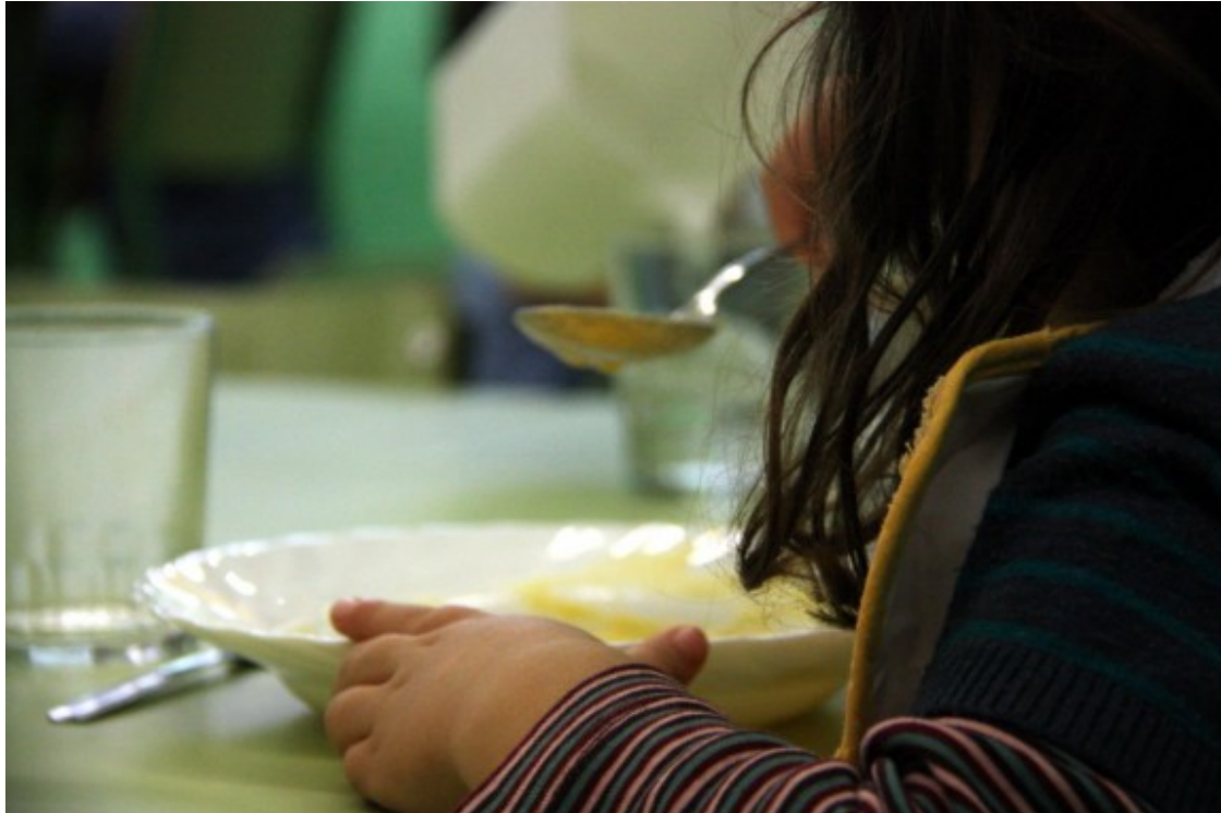
Una nena en un menjador escolar

Cambray explica que valoraran la proposta: "Hem de tenir indicadors qualitatiu i quantitatiu". El director general de centres públics referma la voluntat del Govern de prendre decisions consensuades amb tot el territori, valorant la sostenibilitat del projecte i respectant l'autonomia dels centres.