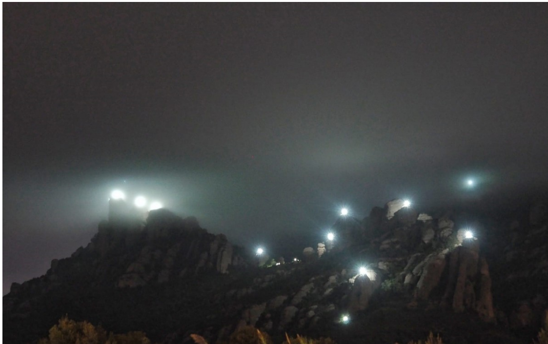
Montserrat il·luminada des del Bruc.

Les 131 agulles del Massís projectaran llum al cel fins demà al matí per retre homenatge als cent trenta-un presidents de la Generalitat i reclamar la llibertat de Catalunya