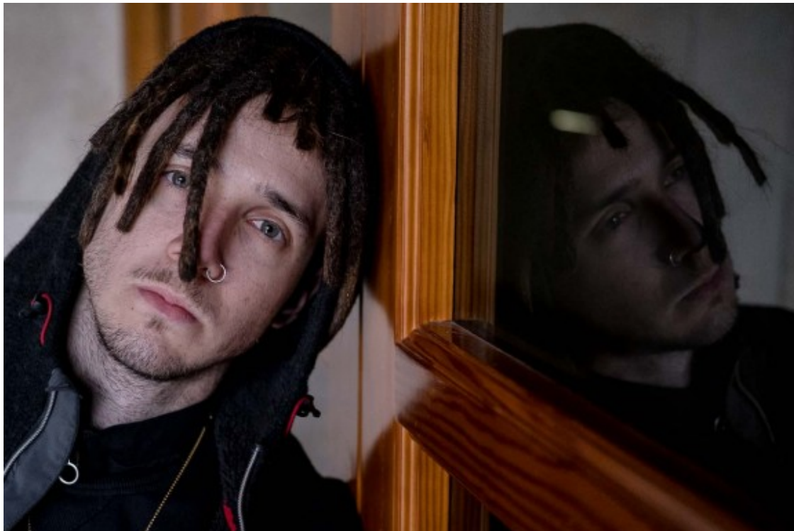
Lildami lidera el gènere urbà en català .

- Estem encantats de donar veu a grups consolidats com P.A.W.N Gang ( https://www.youtube.com/channel/UCK3HgaeRNO-5mJkqvyB1hBA ) o 31 Fam ( https://www.youtube.com/channel/UC9X30uS2tBqnVwEqpmA32xQ ) , però també a grups i artistes emergents de l'escena urbana catalana, com Lil Russia ( https://www.youtube.com/channel/UCrNYZRF2JTjADwzbGRs-3mQ ) . Així i tot, també vindran artistes internacionals i creiem que tot plegat convergirà en una mescla potent, fent d'altaveu als grups d'aquí però sense tancar les portes a grups estrangers.