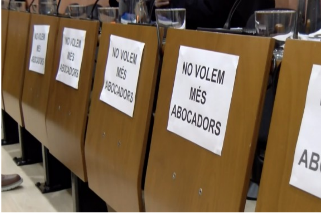
Els grups de l'oposició al ple llueixen cartells contra els abocats

La reunió va comptar amb la presència de regidors de la majoria de partits polítics de Rubí i un de Castellbisbal, representants de partits polítics amb presència o no al ple, de comunitats veïnals i educatives que es veuran directament afectades per l'obertura de l'abocador, a més de membres d'altres entitats polítiques, culturals, esportives i mediambientals de la ciutat.