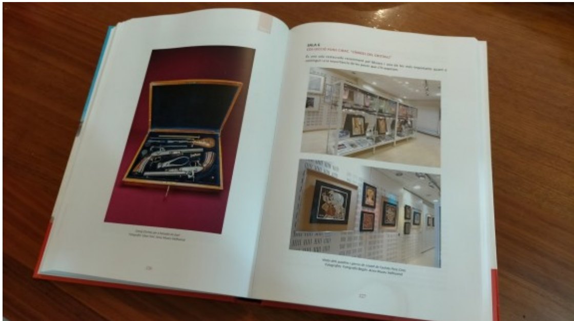
El llibre es presentarà dilluns a l'Auditori Vallhonrat

També tenim un biblio-espai, que conté uns 4.000 llibres, la majoria antics, i una altra sala, l'auditori, on fem les conferències i les exposicions, per intentar donar un servei a la cultura i l'art de Rubí.