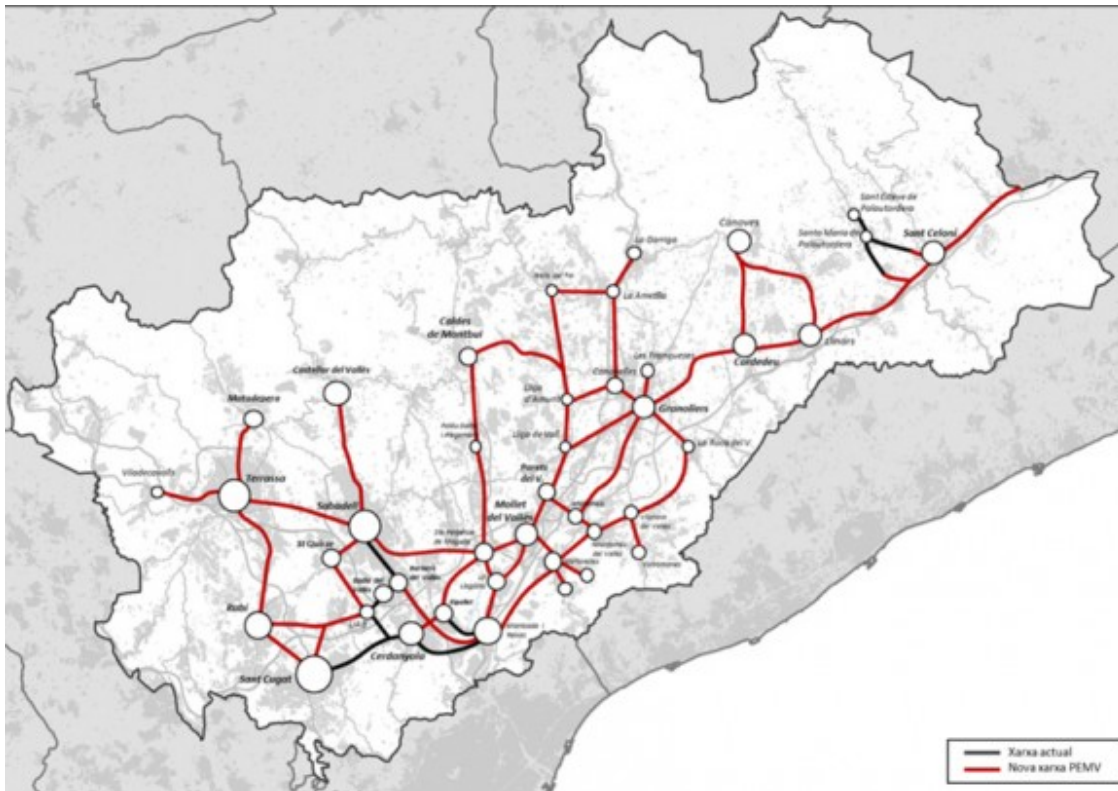
La proposta de carrils bici als Vallesos

Malgrat es faci una aposta clara pel transport públic, el PEMV posa el focus en actuar a les carreteres i això vol dir les principals vies que creuen el Vallès Occidental i Oriental: la C-17, l'AP-7 / B-30 i la C-58. Intervencions "per millorar l'accessibilitat, connectivitat i capacitat", així com la possibilitat d'introduir velocitat variable.