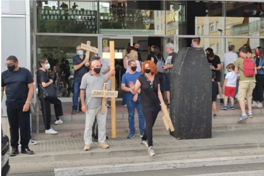
Veïns de Sant Jordi Park protesten davant de la biblioteca