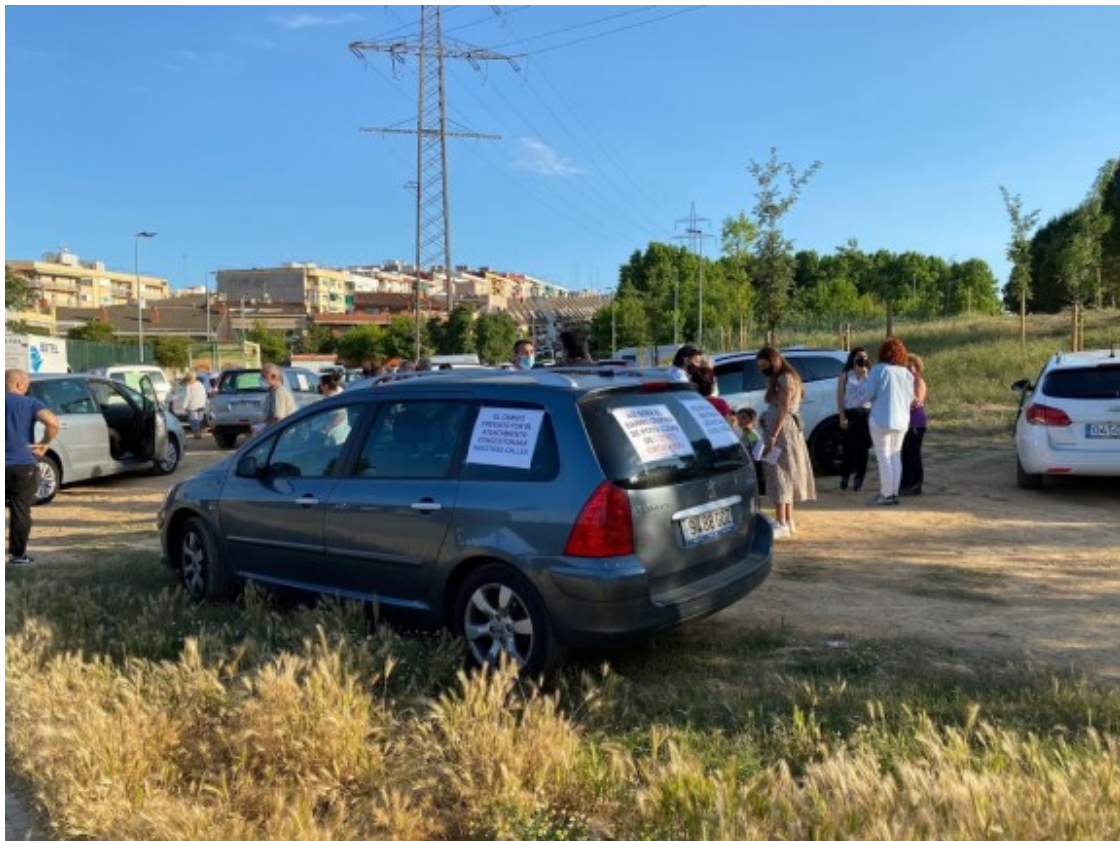
La protesta veïnal de divendres 28 de maig a Sant Jordi Park