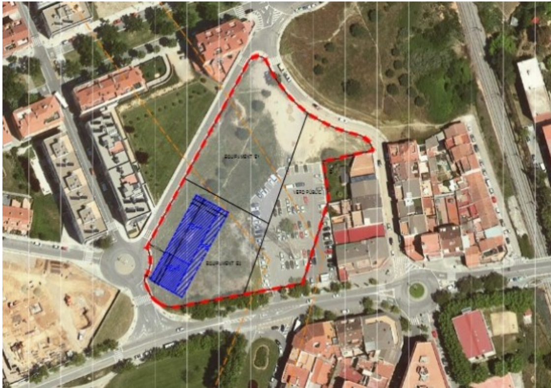
El nou planejament planteja la construcció de dos equipaments dotacionals i el trasllat de la zona verda

En primer lloc, els veïns al·leguen que la memòria ha de contenir una "justificació i motivació suficient de les alteracions del planejament", cosa que segons diuen, no es produeix, i també lamenten que s'hagi fet "de manera totalment unilateral sense garantir una efectiva implicació dels veïns en la definició del model territorial" i acusen els responsables municipals de "declinar qualsevol contacte" per acurar el procediment.