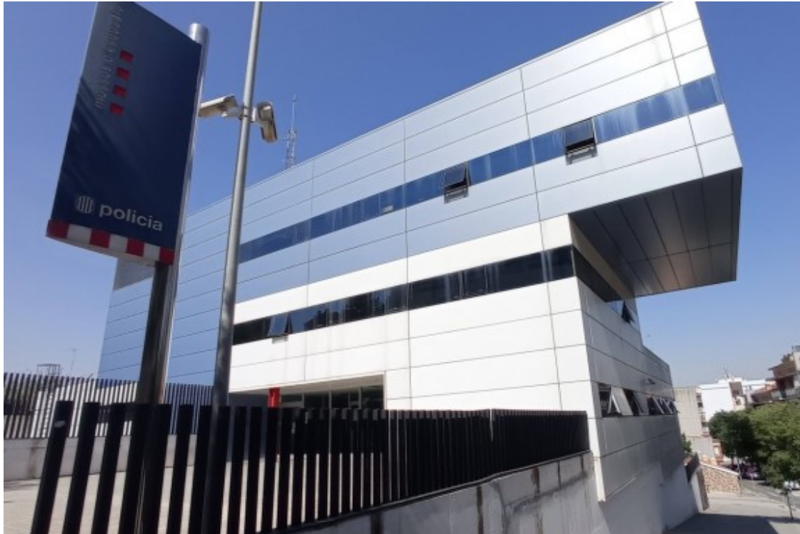
La comissaria dels Mossos d'Esquadra a Rubí

És difícil combatre aquests discursos, i em consta que des de l'àrea de Comunicació de Mossos d'Esquadra s'està fent un esforç, tant a nivell de notes de premsa com de xarxes socials, i que estan fent molt bona feina. Nosaltres, des de l'oficina de Relacions amb la Comunitat com amb els nostres grups de proximitat intentem també fer pedagogia en aquest sentit.