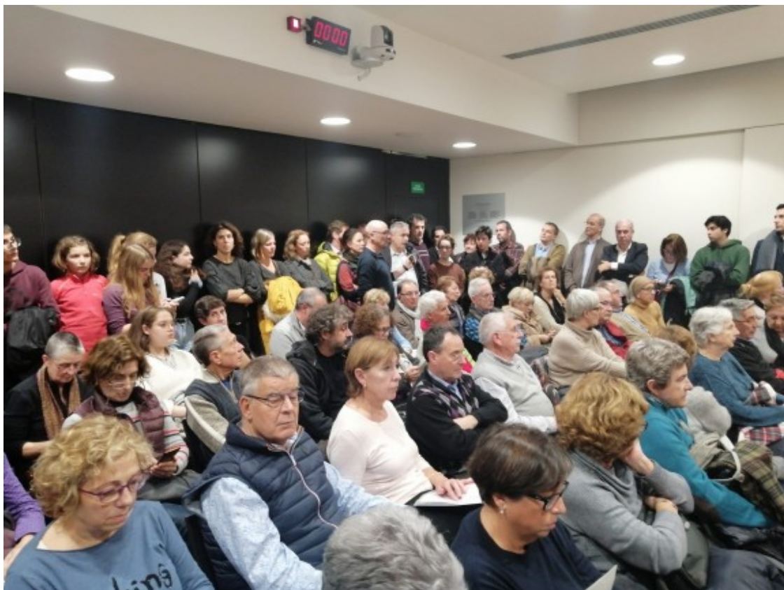
Una audiència pública a l'Ajuntament de Sant Cugat

Després d'un torn de rèplica del responsable polític i un de contrarèplica per part dels assistents, es reserva un últim punt per a les conclusions , si s'escau.